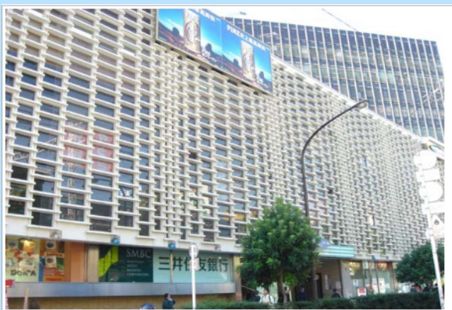
JR山手線 新橋駅 烏森口徒歩1分

階中央のエレベーターより8階へお上がりください。 エスカレーターは4階止まりです。