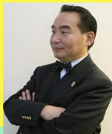
個性心理學研究所®